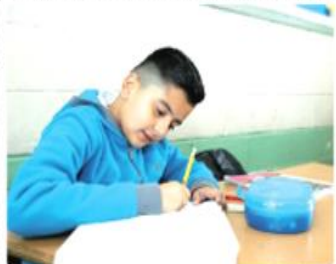
Tijuana.- El nivel básico inició, este lunes, el ciclo escolar 2020-2021 a distancia, en este municipio.